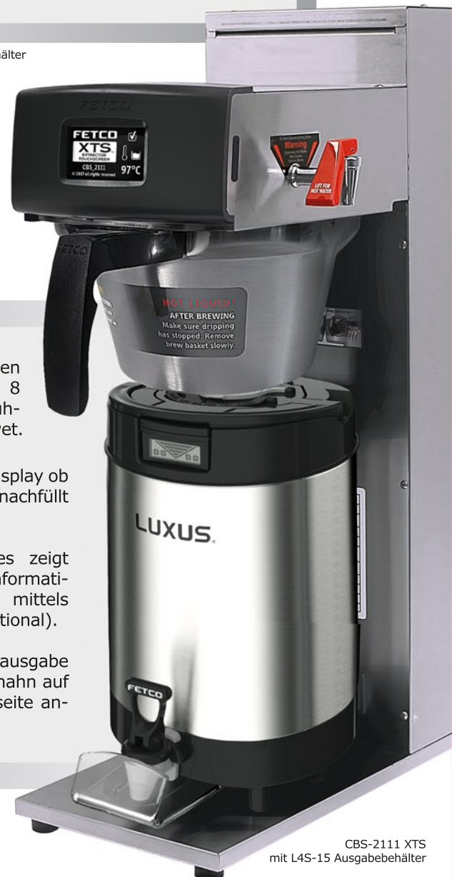
CBS-2111 XTS mit L4S-15 Ausgabebehälter

Die FETCO Filterkaffeemaschine CBS-2111 XTS brüht bis zu 5,7l frischen Filterkaffee direkt in den vacuumisolierten L4S-15 Ausgabebehälter. Ein optional einstellbarer Signalton ertönt am Ende eines jeden Brühvorganges.